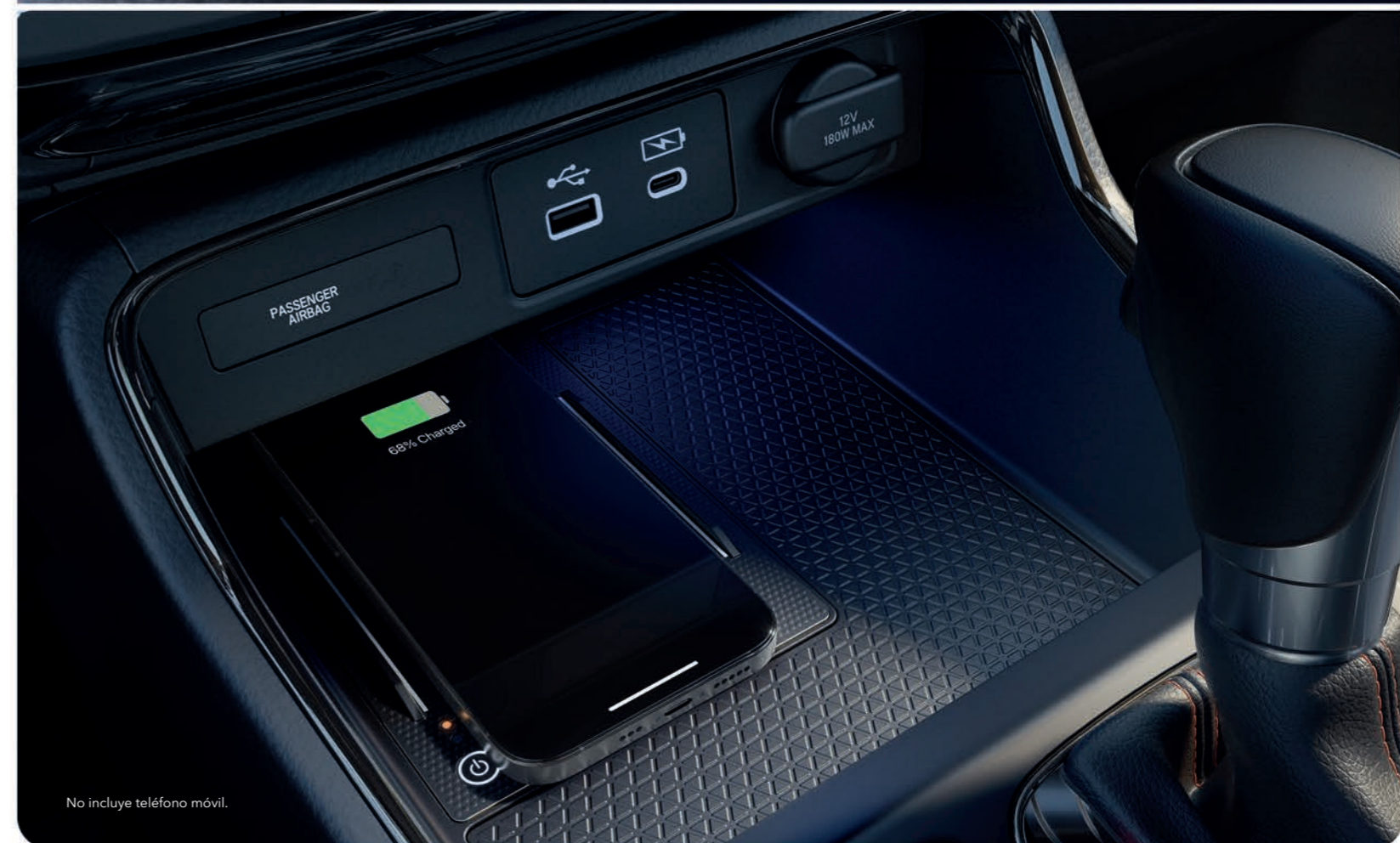
No incluye teléfono móvil.