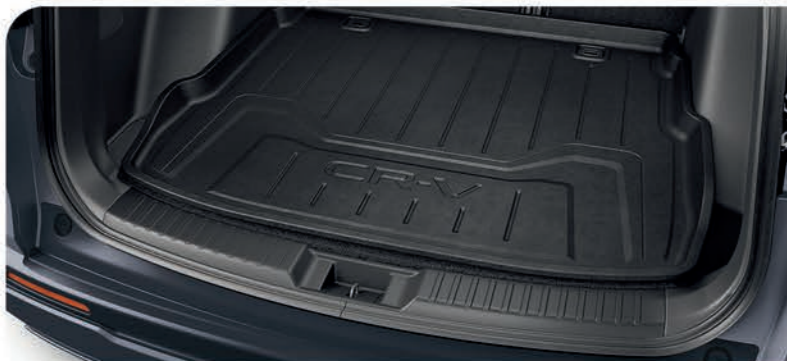
Bandeja de carga