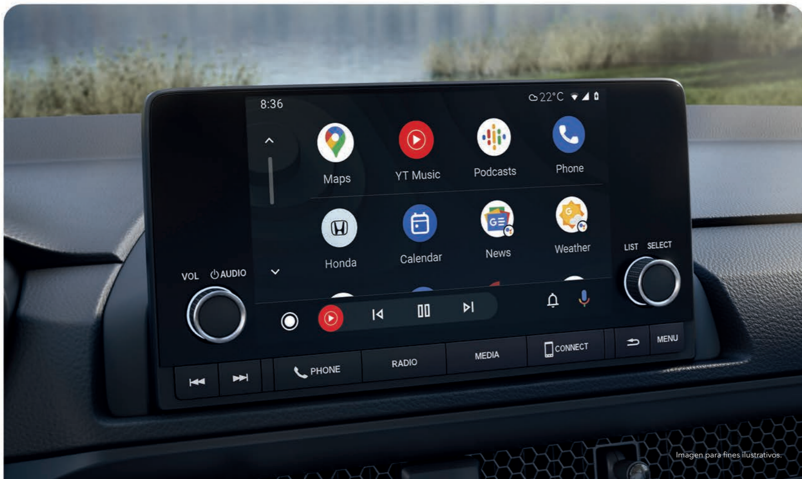
Imagen para fines ilustrativos.