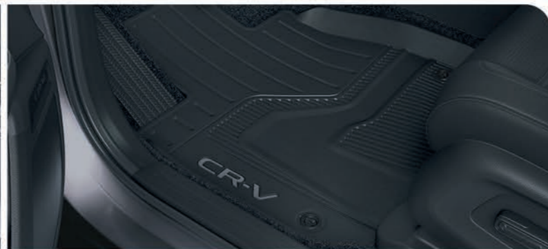
Tapetes toda temporada